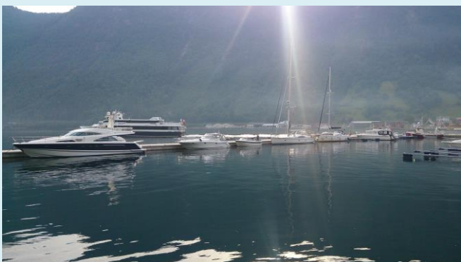
Morgonstemning i båthamna