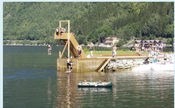
Badeliv i sentrum på Vikøyri