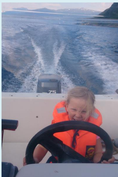
«Full fart - besten!»